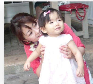
社会人6年目 ママ暦2年目

社会人メンターさんが、毎月1回お話し会を実施。 お預かり、就活、恋愛人生相談など実施★